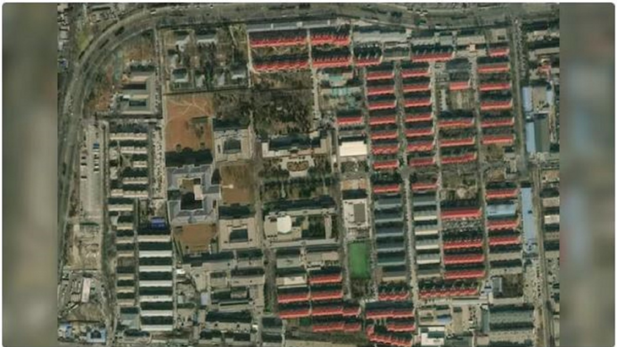
Fig. 2. Instalaciones del MSE en Xiyuan, Distrito de Haidian (Pekín). Fuente:

El MSE es supervisado y dirigido por el Comité Permanente del Politburó que a su vez informa a la Comisión Central de Asuntos Político-Jurídicos, el órgano central del PCCh, organismo que coordina y supervisa la seguridad interior, la actividad policial y las misiones de contrainteligencia y contraespionaje.