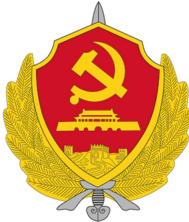
Fig.1. Emblema del Guójiā Ānquán Bù.