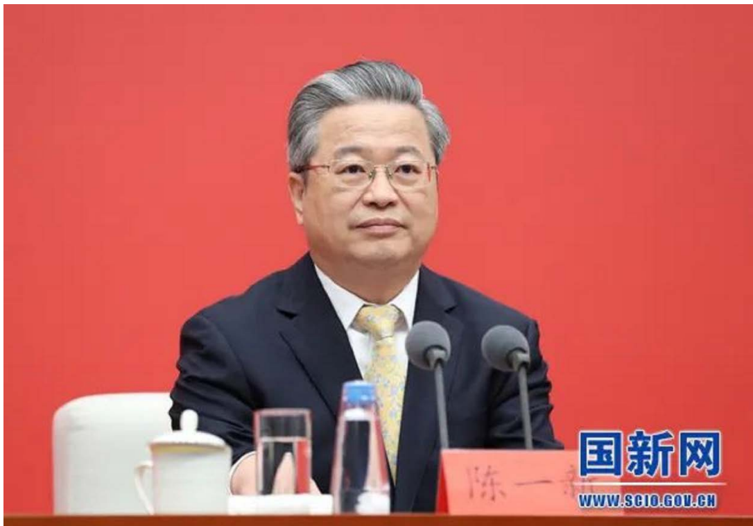
Fig. 3. Fotografía de Chen Yixin.

La sede central del MSE se encuentra en Pakín y, desde el 31 de octubre de 2022, está dirigido por Chen Yixin. Nacido en 1959, Chen fue subsecretario del PCCh en la provincia de Hubei y jefe del Partido en la ciudad de Wuhan. También fue jefe del PCCh en Wenzhou, provincia de Zhejiang, entre junio de 2013 y noviembre de 2015. Entre 2018 y 2022 ejerció el cargo de secretario general de la Comisión de Asuntos Políticos y Jurídicos del Comité Central del PCCh 7 .