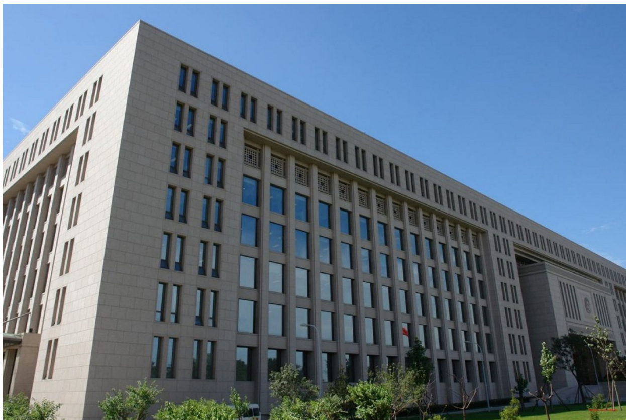
Fig. 4. Imagen de una sede del MSE ( Guóānbù ). Fuente: South China Morning Post .

Disponible en: https://www.scmp.com/news/china/politics/article/2179179/what-do-we-actually-know-about-chinas-mysterious-spy-agency