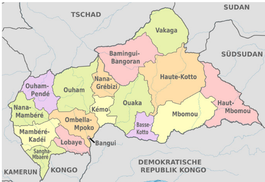
Figura 1. Mapa administrativo de la RCA.

En términos geográficos, RCA constituye una meseta situada en el África Central. Su localización no costera le obliga a abastecer su comercio mediante el río Ubangui, un afluente del río Congo. Limita con Camerún, el Chad, la República Democrática del Congo, el Congo, Sudán y Sudán del Sur.