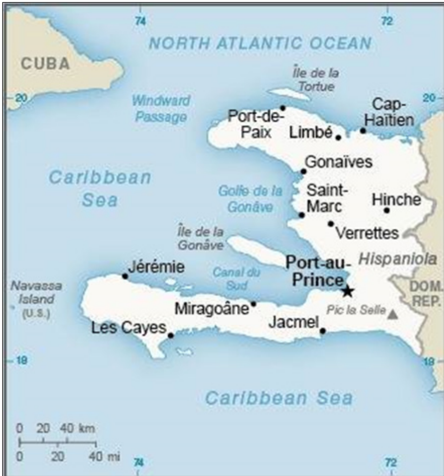
Figura 1. Mapa de Haití