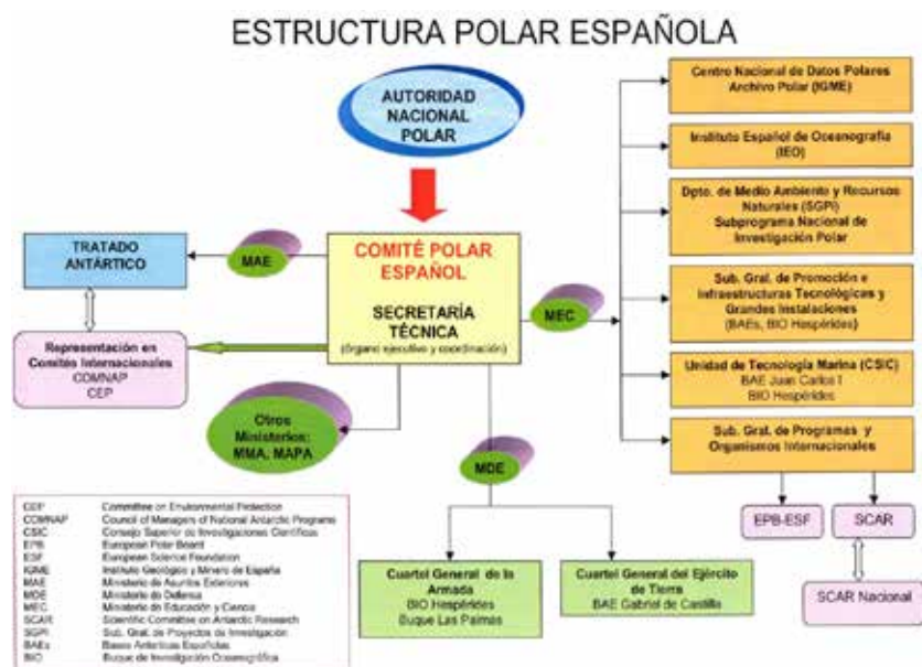
Gráfico 2.