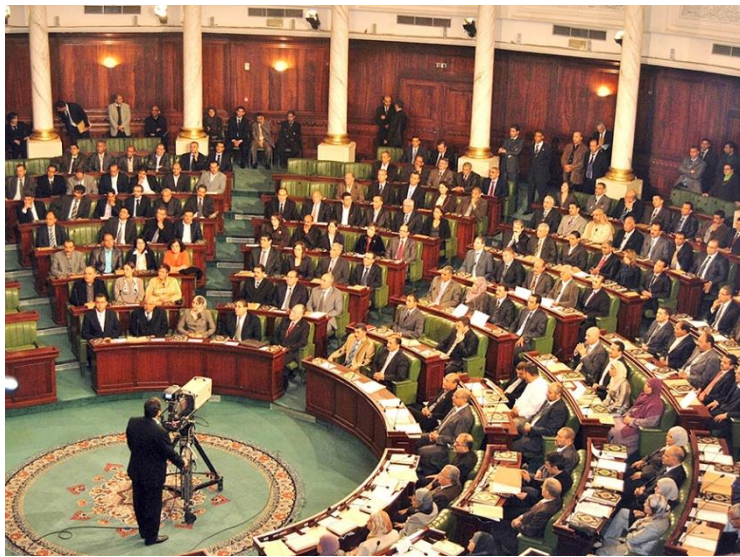
La Asamblea Nacional Constituyente

El pasado 26 de enero de 2014, la Asamblea Nacional Constituyente (ANC) aprobó una nueva Constitución con 200 votos afirmativos, 12 en contra y solo 4 abstenciones, es decir, con más de la mayoría de los dos tercios que requiere la Ley de Organización Provisional de Poderes Públicos. Fruto de la voluntad de acuerdo, del compromiso con la sociedad y de una clara voluntad de pacto, es un primer logro de la primavera tunecina. Además, la carta magna ofrece un difícil equilibrio entre islamismo y laicismo constitucional y, precisamente, en este delicado asunto reside parte de su interés como modelo y precursora para futuros estados árabes democráticos.