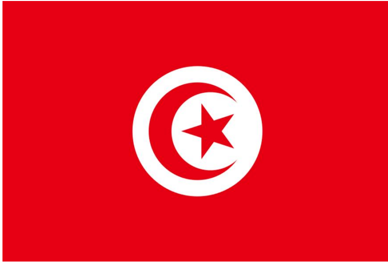
Bandera de Túnez

Para otros, la carta magna es poco coherente con el compromiso entre los partidarios de un régimen parlamentario clásico y otro presidencial y temen que el poder del presidente de la República sea honorífico en exceso.