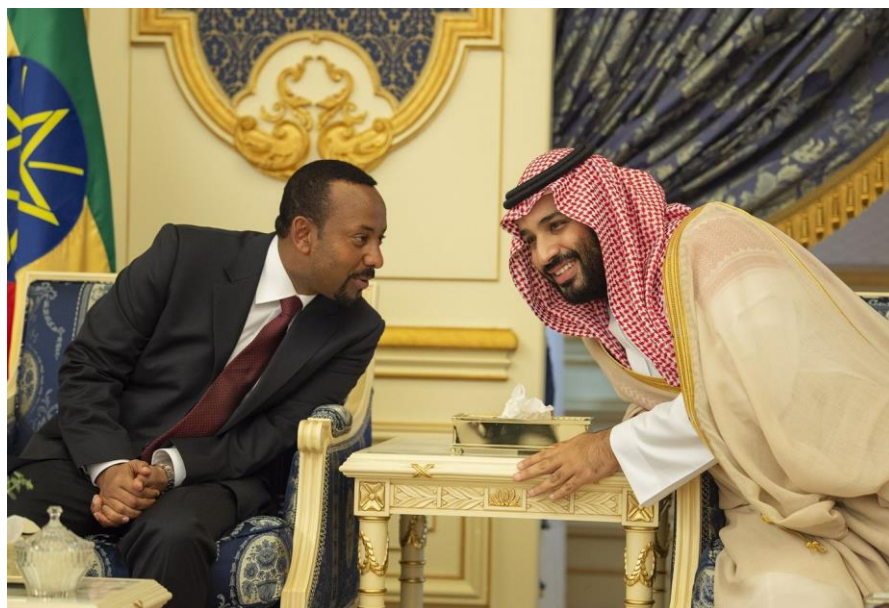
Foto 4. El príncipe saudí, Mohamed bin Sálman y el primer ministro de Etiopía, Abiy Ahmed durante la firma de los acuerdos de paz entre Eritrea y Etiopía en 2018.

Riad ve un nexo entre Yemen y el Cuerno de África. Desde que comenzó la intervención militar en este país en marzo de 2015, la región ha sido considerada un área de influencia estratégica para operar en este conflicto. Por ello, Arabia Saudí presionó a los distintos gobiernos de los países del Cuerno para que forjaran una alianza y avanzaran contra la milicia hutí en Yemen. Sudán, Eritrea y Somalia se unieron entonces al eje militar liderado por Arabia Saudí. Este tipo de cooperación militar con países africanos se ve fortalecida a menudo con incentivos económicos. Así, Arabia Saudí depositó 1.000 millones de dólares en el banco central de Sudán poco después de que este país aportara más de mil soldados a la lucha en Yemen en 2015 22 . La prioridad en la política regional saudí es la resolución del conflicto en Yemen, pues este se ha convertido en un desastre económico y de seguridad para Riad en los últimos años. Las recientes conversaciones directas con Irán muestran la voluntad política de Arabia Saudí de superar este conflicto por la vía diplomática, ya que una solución militar se ha vuelto poco probable.