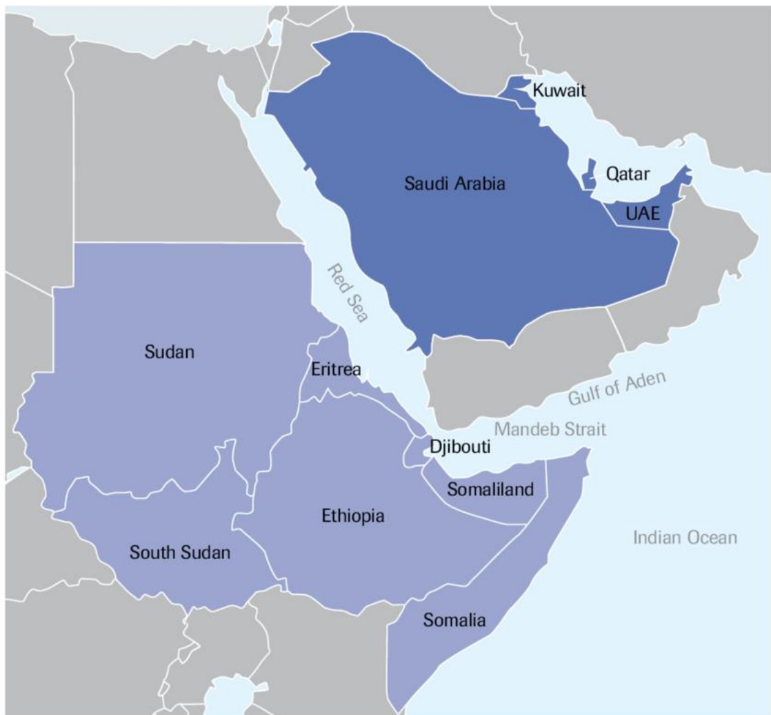
Foto 1. Mapa del Cuerno de África y la península arábiga.

En los últimos quince años, los Estados del Consejo de Cooperación del Golfo principalmente Arabia Saudí, Emiratos Árabes Unidos (EAU) y Qatar— han estrechado lazos económicos y de seguridad al otro lado del mar Rojo, lo que ha potenciado su papel económico y diplomático en los países de África subsahariana donde su presencia es mayor. Emiratíes, saudíes y qataríes trabajan en esta región con el objetivo de construirse un estatus de potencia internacional mediante la actuación como actores de primer orden en los asuntos y conflictos del continente.