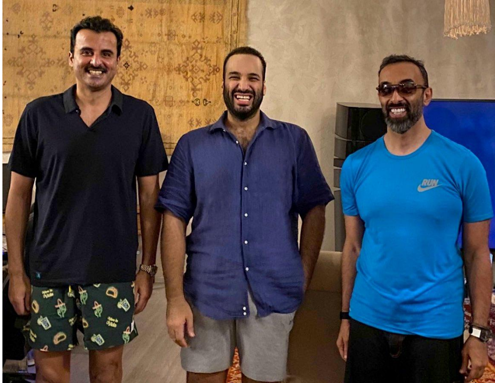
Foto 6. El emir de Qatar, Al Thani, el príncipe saudí Mohamed bin Sálman y el responsable de seguridad nacional de EAU, Tahnoun Bin Zayed Al Nahyan (hijo del fundador y primer presidente de EAU) en un encuentro en el mar Rojo en septiembre de 2021, pocos meses después de la recomposición de las relaciones diplomáticas entre las monarquías del Golfo.

La expansión de emiratíes, saudíes y qataríes en el Cuerno de África va acompañada de la exportación de sus rivalidades a una región que ya tiene muchas. Y no son las únicas potencias extranjeras que prestan ahora atención a esta región. China ha establecido en Yibuti su primera instalación militar en el extranjero, a sólo diez kilómetros de la única base estadounidense en África, lo que convierte al mar Rojo en un nuevo escenario de la competencia entre grandes potencias. En su centro se encuentra el estrecho de Bab Al Mandeb, el corredor marítimo por el que pasan cientos de miles de millones de dólares en petróleo y otras exportaciones entre Europa, Asia y el Golfo. El mar Rojo se está convirtiendo en un escenario de intrigas geopolíticas. En sus orillas una serie de actores estatales —con diferentes culturas, diferentes modelos de gobierno y diferentes estilos de diplomacia— se están tanteando mutuamente. Abundan las