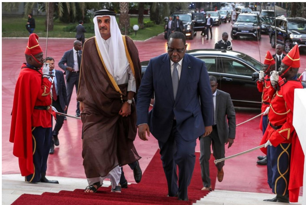
Foto 5. El emir de Qatar y el presidente de Senegal, Macky Sall, durante la gira del dirigente qatarí por África occidental.

allá de la inversión de petrodólares en África subsahariana. En los últimos años, Qatar ha abierto más embajadas en África subsahariana que cualquier otro Estado, con la excepción de Turquía.