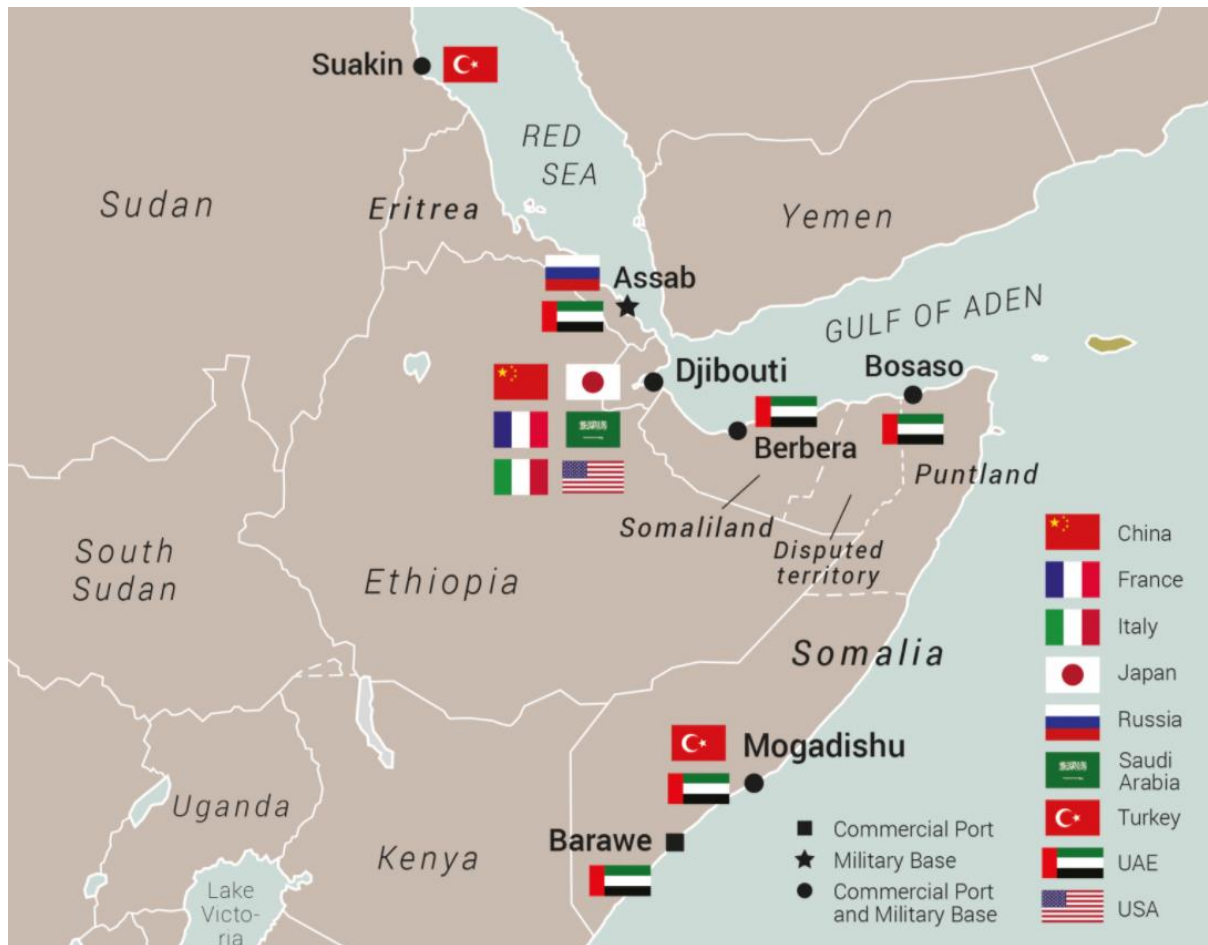
Foto 3. Puertos y bases militares en el Cuerno de África.

Esta política de inversiones portuarias está también al servicio de la estrategia de seguridad alimentaria. El clima árido de EAU obliga al país a depender de las importaciones de alimentos y se calcula que el 90 % del consumo nacional es importado. Los proyectos de adquisición agrícola en suelo africano se consideran verdaderas inversiones estratégicas, especialmente en el actual contexto del conflicto ucraniano, que tanta influencia está ejerciendo sobre el suministro y los precios de los productos básicos. Junto con Arabia Saudí y Qatar, EAU es uno de los principales compradores de tierras agrícolas en África subsahariana. Abu Dabi posee tierras cultivables en Nigeria, Namibia, Marruecos y Ghana; en Sudán, los inversores emiratíes han comprado más de 400.000 hectáreas y la empresa Al Dahra Agriculture firmó en 2015 un acuerdo para inyectar