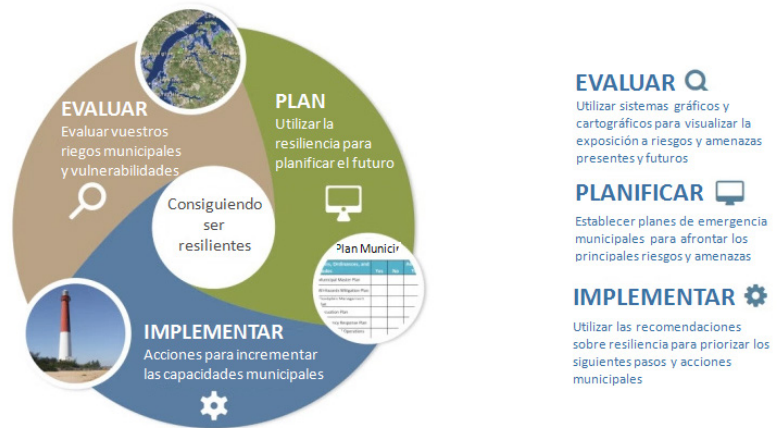
Figura 3. Elaboración Propia a partir del Plan de resiliencia de Nueva Orleans.

miembros de la Alianza debe ser mejorar el nivel de resiliencia de sus ciudades y a la vez exportarlo a sus vecinos próximos y también lejanos.