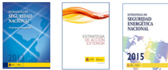
Figura 1. Resiliencia y Estrategias de España 2013-2015.

de autoprotección...» 15 . En particular la estrategia española de Seguridad de 2013 señala cuatro ámbitos en los se debe mejorar la seguridad y resiliencia, que son los siguientes: (1) Seguridad económica y Financiera; (2) Ciberseguridad; (3) Protección individual ante emergencias y catástrofes; Y, (4) también en infraestructuras críticas tanto públicas como privadas, desarrollando si fuera posible sistemas redundantes o duplicados para poder realizar su reposición si fuera necesario.