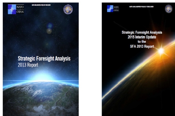
Figura 2. Informes Strategic Foresight Analysis 2013 y 2015.

o humano. 25 Respecto al Aspecto Tecnológico también se resalta la gran dependencia de algunas tecnologías y que estas dejen de estar coordinadas por los estados, sino por las marcas comerciales pueden aumentar la vulnerabilidad de nuestras sociedades. El tema de la resiliencia también es tratado al abordar la cuestión del Medio Ambiente , ya que se considera que el cambio climático es un multiplicador de las amenazas. Las infraestructuras urbanas y los equipos de defensa y seguridad deberán de ser más resilientes a condiciones climáticas adversas y a continuar operando a pesar de los desastres naturales.