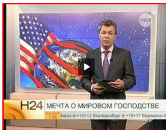
“El sueño de un dominio mundial”

Los EEUU, por ejemplo, se muestran a los espectadores como una amenaza para la independencia de cualquier estado, lo que explica el resurgimiento del sentimiento antiamericano.