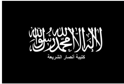
Bandera de Ansar Al-Sharia