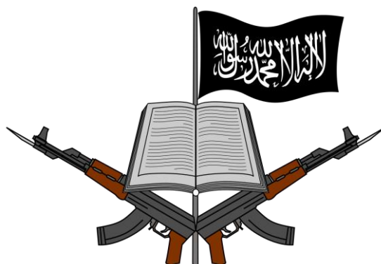
Logo de Boko Haram

En este país africano existía desde el año 2002 un grupo denominado Boko Haram, de carácter claramente yihadista y terrorista 35 , al que sus relaciones con otros grupos terroristas como Al Qaeda en el Magreb Islámico lo convirtieron en una amenaza regional pasando a ser el mayor grupo terrorista del continente africano. A partir del año 2009 inicia una dura campaña militar con el objetivo de imponer la ley islámica en las regiones del norte del país.