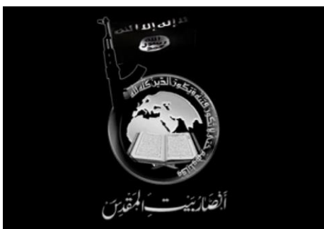
Logo de Ansar Bait al-Maqdis

Como en otros casos la situación en la que se encontraba Ansar Bait al-Maqdis no era la mejor. Tras la sustitución del gobierno de Mursi y la organización, digamos de carácter islamista moderada, los Hermanos Musulmanes, por el nuevo Presidente Al Sisi, la organización estaba sufriendo un gran desgaste por el acoso de las Fuerzas de Seguridad egipcias durante todo el año 2014 44 , eliminando a gran parte de la militancia con tendencia a unirse a Al Qaeda. Ello produjo grandes cambios en la cúpula de la organización que la acercó a los ideales de Daesh . A lo largo del año las fuerzas de seguridad egipcias localizaron y eliminaron a varios líderes, incluso en el mismo día cayeron dos de los principales nexos de unión del grupo con Al Qaeda.