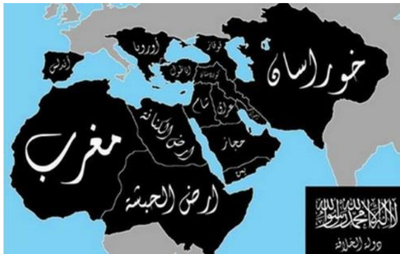
Mapa de sus pretensiones elaborado por el propio grupo y difundido a través de las redes sociales

Como Estado Islámico de Irak y responsable de la muerte de miles de civiles iraquíes, de miembros del gobierno y de efectivos de las tropas internacionales, sufrió el acoso y persecución de las fuerzas de seguridad iraquíes con el asesoramiento de Estados Unidos lo que condujo al movimiento a su casi desaparición. Con motivo de la guerra civil siria el grupo se renovó ampliando su ámbito de actuación a ambos países, Irak y Siria, llegando incluso a derribar los puestos fronterizos en una primera demostración de que para el grupo no existen fronteras y cambiando su nombre por el de Estado Islámico de Irak y el Levante. El siguiente paso fue cortar de raíz los lazos con su organización madre, Al Qaeda, declararse independiente y posteriormente proclamar el califato del que posteriormente se hablará.