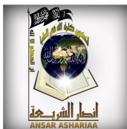
Logo de Ansar al-Sharia en Túnez

El reciente atentado contra turistas en el Museo Bardo de la capital ha puesto en evidencia la punta del iceberg en este pequeño país del norte de África. Desde el derrocamiento del presidente Ben Ali en 2011, con motivo de los levantamientos populares que se denominaron primavera árabe, se han sucedido diversas escaramuzas con grupúsculos terroristas yihadistas. Escaramuzas que han ido en aumento por la inestabilidad del país vecino, Libia, y del gran número tanto de armas como de combatientes con experiencia de combate que hay en circulación. Muestras claras de la influencia que tiene Libia en la seguridad de Túnez son la presencia de combatientes tunecinos integrados en los grupos islamistas y yihadistas que combaten en Libia 40 .