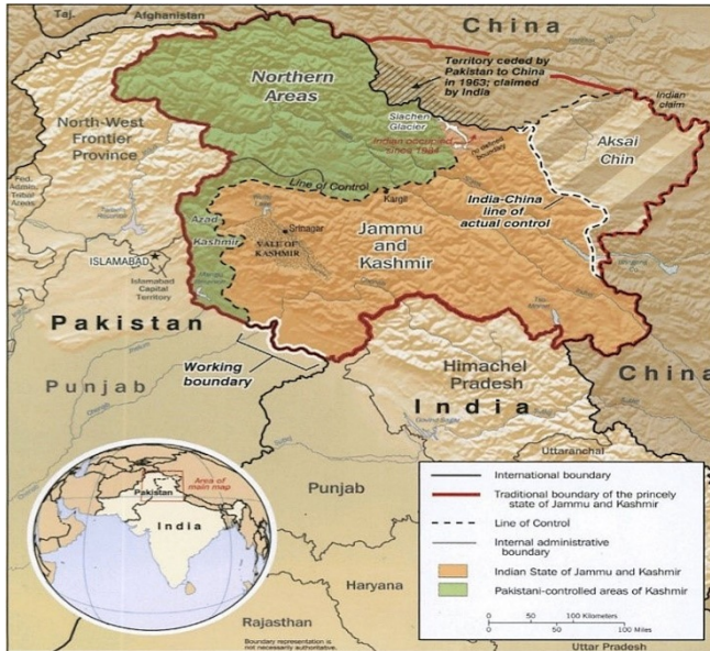
Figura 2 – Principado Jammu–Cachemira.