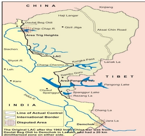
Figura 4 – Línea de Control Real Aksai Chin.

Delhi decidió ejecutar una nueva política de avance en los sectores disputados intensificando controles fronterizos y puestos de vigilancia. Fue el preludio de la guerra.