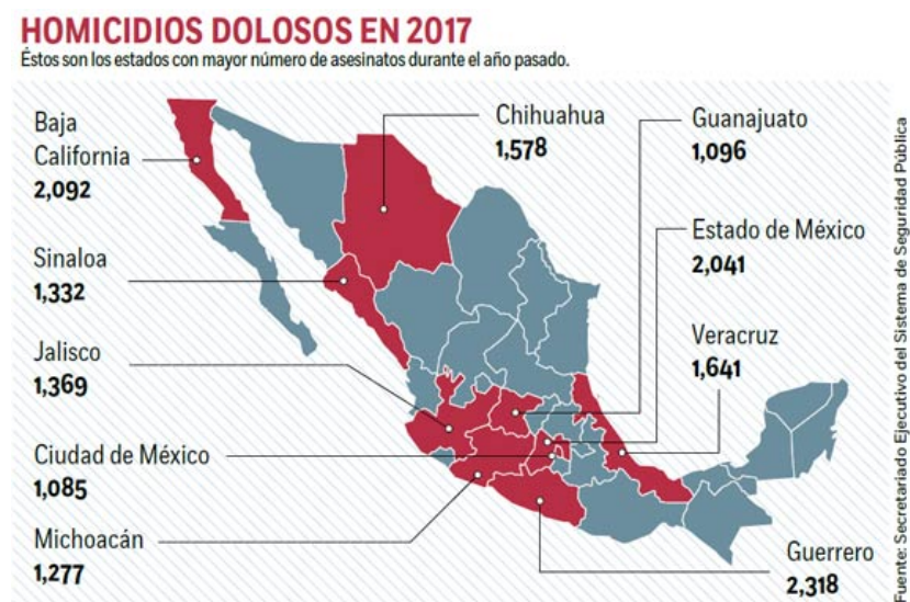
Figura 1. Estados con más homicidios en 2017.

Desde el año 2006, México vive inmerso en una ola continua de violencia, que alcanzó su punto más álgido en 2017, cuando se registraron 31 174 homicidios, lo que supone una tasa de 25 homicidios por cada 100 mil habitantes, según datos del Instituto Nacional de Estadística y Geografía de México (INEGI) 1 . A la hora de analizar los datos, resulta bastante curioso que si tomamos el total de personas fallecidas por homicidio, las cifras podrían llegar a ser comparables con las de la guerra de Siria. Por el contrario, si analizamos la tasa de homicidios, esta se mantiene baja en comparación con otros países de América Latina 2 .