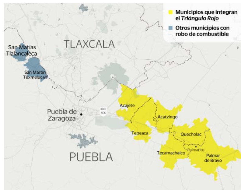
Figura 3. Principales municipios que forman el denominado Triángulo Rojo. Fuente: El Universal . 15

La primera cuestión es definir ¿qué es huachicoleo o huachicol ? Atendiendo a la etimología, la palabra huachicol hace referencia en origen a una bebida alcohólica adulterada que se prepara con alcohol de caña 14 y que al no cumplir unas condiciones óptimas de preparación y conservación puede provocar temblores, ceguera, fuertes dolores de cabeza e incluso la muerte. Actualmente esta palabra ha tomado un nuevo significado que hace referencia a robo de combustible y por lo tanto, los huachicoleros , son aquellas personas que viven de este negocio. En el huachicoleo intervienen desde pobladores rurales hasta grupos del crimen organizado, con los cuales se alían en algunas ocasiones y en otras tantas compiten. En este caso, se prestará especial atención a las bandas locales, ya que ellos encarnan la esencia del huachicoleo .