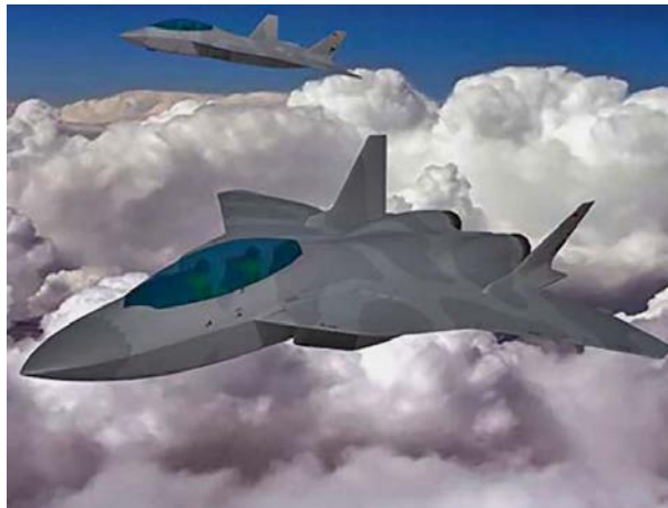
Imagen 7. The Next Generation Weapon System (NGWS) to replace the Tornado.

Todos estos avances se ven reflejados en algunos sus actuales proyectos como el desarrollo del nuevo diseño del avión de combate de 5ª generación o Next Generation Weapon Systems (NGWS) 17 entre Francia, Alemania y España 18 (imagen 7). O como el futuro carro de combate europeo European Main Battle Tank (EMBT) que sustituirá a los Leclerc franceses y Leopard alemanes (imagen 8); o como el Fondo Europeo de Defensa, propuesto por la Comisión Europea en el contexto del Marco Financiero Plurianual 19 para 2021-2027 adoptado por el Consejo.