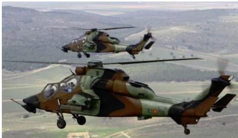
Imagen 3. Eurocopter EC665 (Tigre).