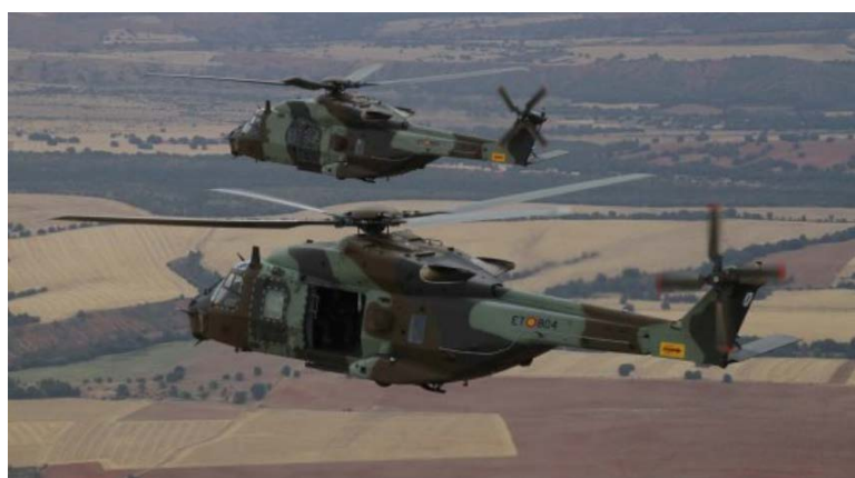
Imagen 4. NH-90 Caimán.