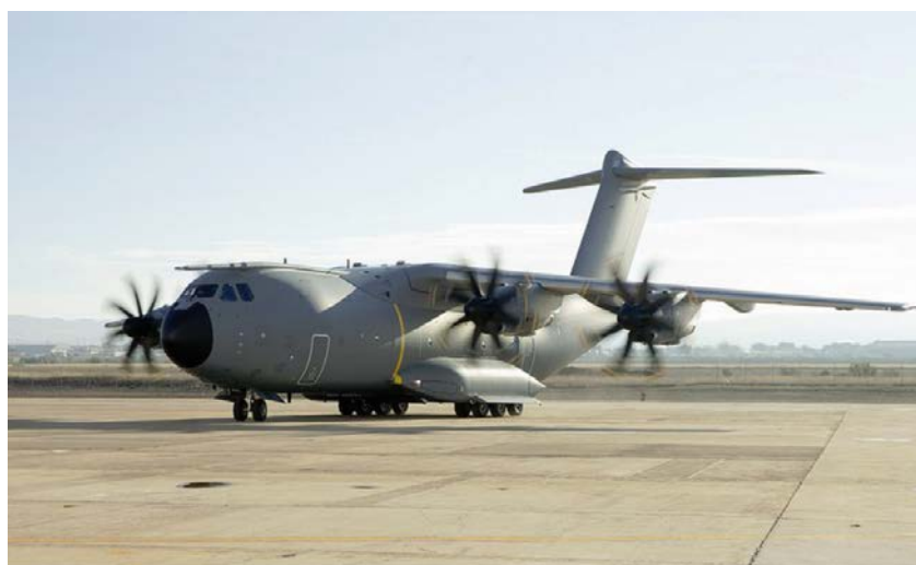
Imagen 5. Airbus A400M Atlas (T.23).