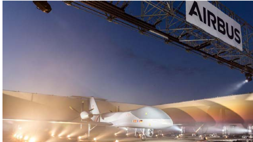
Imagen 6. Airbus MALE RPAS.