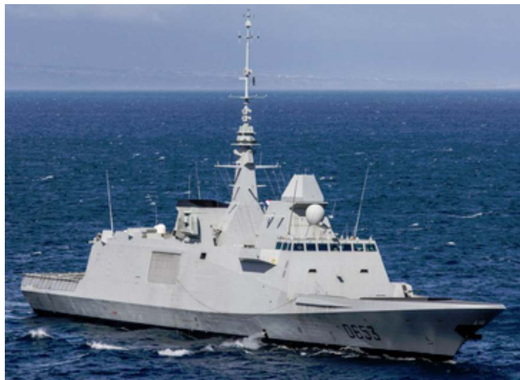
Imagen 2. Fragata FREMM Languedoc (D 653).