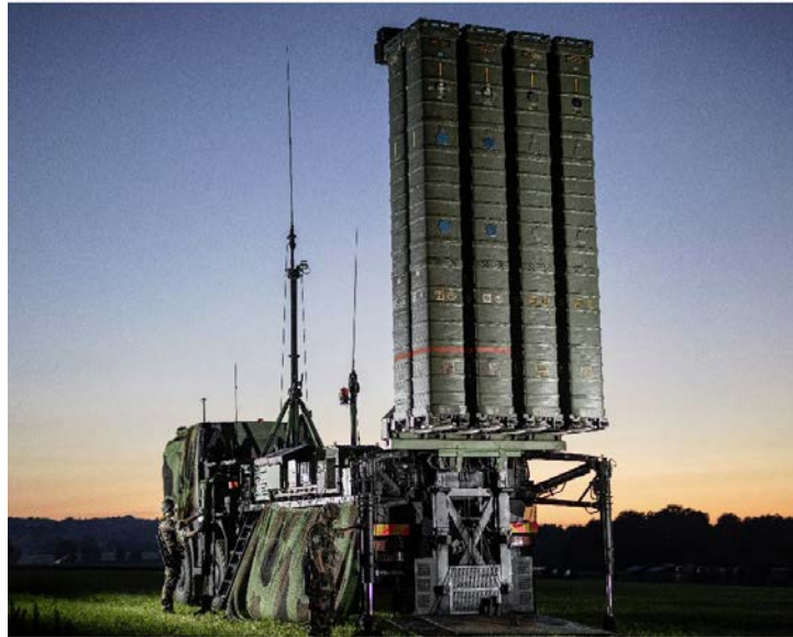
Imagen 1. Eurosam GIE.

El Convenio OCCAR entró en vigor en 2001, uniéndose más tarde Bélgica y España. Destacar de este convenio programas como la familia FSAF –Eurosam GIE–, de misiles tierra-aire (imagen 1), la fragata FREMM (imagen 2), los helicópteros Tigre y el NH-90 Caimán (imágenes 3 y 4 respectivamente), el avión de transporte militar (y cisterna) A400M (imagen 5) o el nuevo programa europeo MALE RPAS 12 (imagen 6), entre otros proyectos.