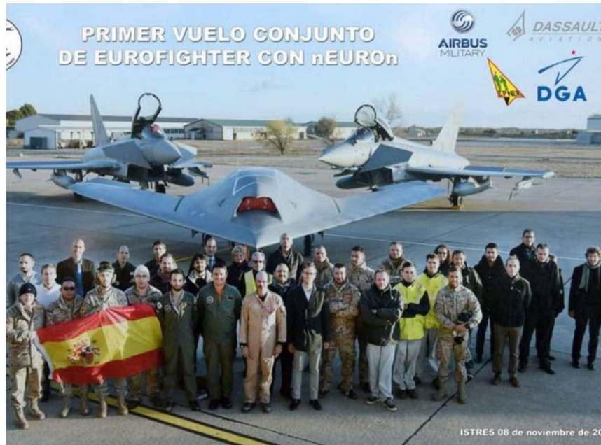
Imagen 9. Miembros de la empresa española Airbus, pilotos del Ejército del Aire y representantes del centro de Ensayos en Vuelo de la Dirección General de Armamento francesa y el operador de Dassault.

suministro globales, disminuyendo los tiempos de entrega y aumentando el tiempo operacional 26 .