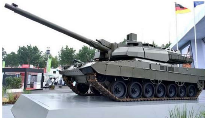
Imagen 8. Primer tanque europeo EMBT.

Además, la PCSD se centra en las diversas dimensiones de la gestión de crisis y en absoluto en la «defensa territorial» de sus Estados miembros. No fue diseñada para operaciones militares a gran escala y las capacidades militares europeas, no se basan en la creación de un ejército permanente europeo, sino en la contribución «voluntaria y temporal» de sus Estados miembros para la realización de las operaciones/misiones en el marco de la PCSD.