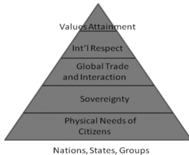
Figura 1. Variación de la pirámide de Maslow aplicable a sociedades humanas.