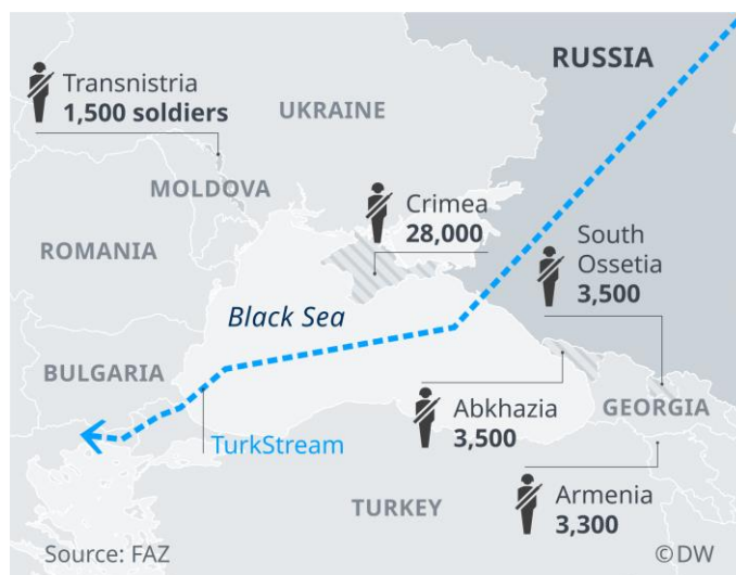
Figura 2. Trazado del Turkstream y despliegues de fuerzas rusas.

Turquía representa el segundo mercado importador de gas ruso tras Alemania y Rusia es el segundo suministrador de petróleo a Turquía tras Irak 25 . Además, se une la posición geográfica de Turquía para poder distribuir el petróleo y el gas a Europa. Así, a principios de enero de 2020, Putin y Erdoğan inauguraron el gasoducto TurkStream que une los países por el mar Negro y lleva gas a Europa a través de los Balcanes 26 .