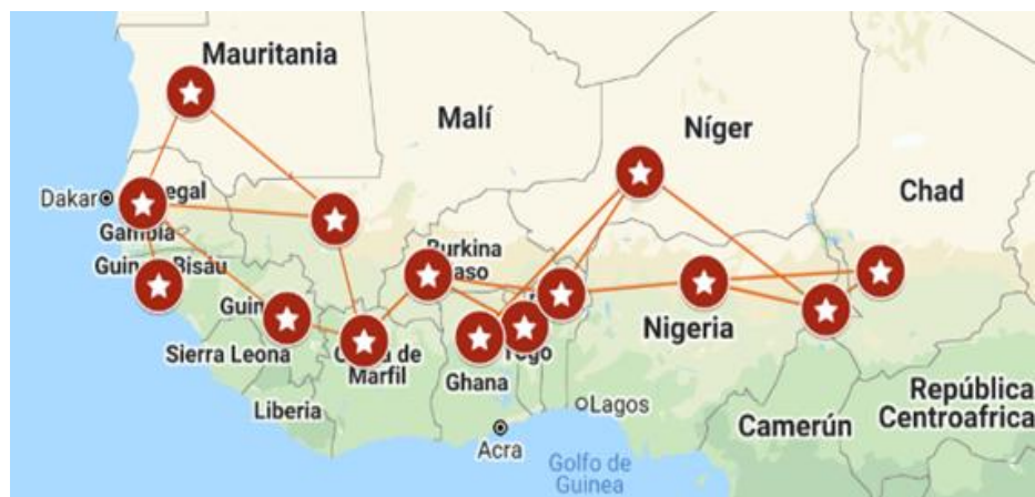
Figure 2. Carte des pays d'origine et de destination des enfants dans les écoles coraniques et les mouvements transnationaux

Cela ne se produit pas dans toutes les écoles d'enseignement islamique traditionnel, mais cela se produit dans beaucoup d'entre elles sans que les gouvernements ou les grandes confréries soufies d'Afrique de l'Ouest ne fassent rien contre. Bien qu'elle ne concerne pas seulement les enfants peuls, une grande majorité des enfants de ces écoles sont originaires de régions où l'on parle le peul 28 . Par exemple, ils sont très visibles dans le nord de la Côte d'Ivoire (enfants peuls venant principalement du Mali 29 ) ou dans le nord du Bénin (enfants peuls venant du Niger) 30 , au Sénégal il y a une majorité d'enfants venant de Kolda du côté du Sénégal et du côté de la Guinée Bissau avec une majorité de population peule.