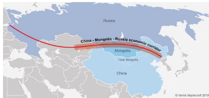
Figura 1: Corredor económico China-Mongolia-Rusia

En el marco del trilateralismo Mongolia-China-Rusia 9 , originado por el acercamiento sino-ruso tras la crisis de Ucrania (2014), se aprobó en 2017 el programa para la creación del corredor económico China-Mongolia-Rusia (figura 1) con el objetivo de ampliar la cooperación entre los tres países. Al ser una alternativa a las dos rutas ya existentes (entre China y Asia Central y entre la Región Autónoma de Mongolia Interior, en China, y Rusia), este se caracteriza por la entrega de carga a alta velocidad y, al atravesar una zona libre de conflictos, por los bajos riesgos. Su objetivo es desarrollar una red de transporte transfronterizo, mejorar la cooperación energética y crear dos zonas de libre comercio 10 . La construcción de vías férreas, carreteras y oleoductos que unirán Mongolia y China con Rusia demuestra que la iniciativa no es mera retórica. Sin embargo, el corredor presenta algunos problemas, como la baja competitividad, en comparación con las rutas marítimas, y un escaso atractivo para potenciales inversionistas, debido al bajo potencial de actividad económica en los territorios contiguos. Z. Dondokov afirma que la eficacia del proyecto dependerá de factores institucionales, como la existencia de un mecanismo de participación de las partes interesadas 11 .