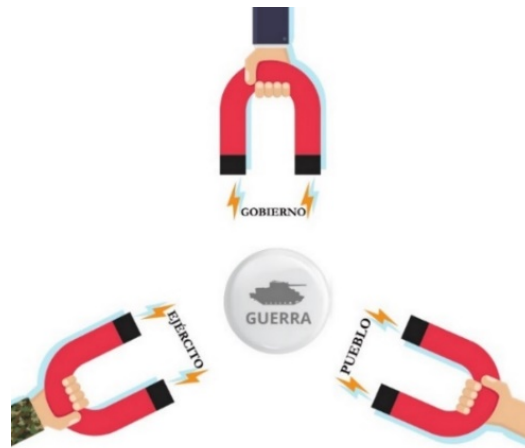
Figura 2. Representación gráfica de los elementos que componen la trinidad de Clausewitz

El conflicto de Georgia en 2008 resulta ser el mejor ejemplo. Dos divisiones mecanizadas y dos aerotransportadas con apoyos de fuegos a través de dos frentes de avance distintos desbordaron las líneas georgianas en pocas horas: velocidad, contundencia, sincronización, amplitud de frente, mantenimiento del ritmo de operaciones, características todas ellas definitorias del cuerpo doctrinal descrito.