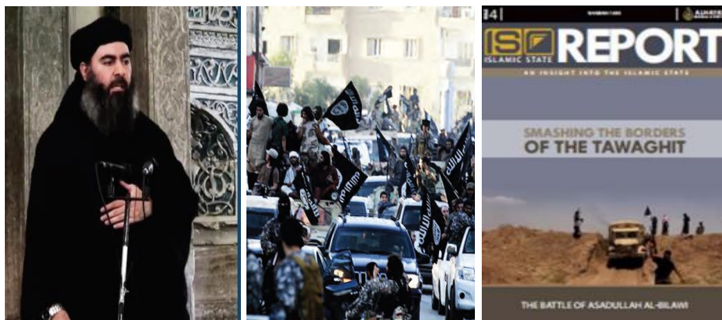
Figura 1. Imágenes de las revistas Dabiq e Islamic State Report relativas a la declaración del «califato».

Sobre todo, desde 2014: con la ruptura entre AQC y el Dáesh 22 y la declaración de «califato» de este último grupo se materializó un hecho largamente esperado por el yihadismo. La creación de un «Estado islámico» marcó un antes y un después: añadió a la legitimidad moral del líder de esta organización dentro del movimiento yihadista la legitimidad política derivada de la existencia de un «califa», cuyas decisiones «han de ser obedecidas por todos los musulmanes».