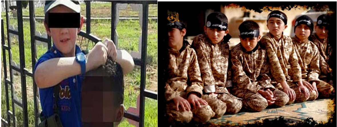
Figura 5. Imágenes de niños en el «califato». A la izquierda, el hijo de un australiano que viajó a Siria y se integró en el Dáesh 45 . A la derecha, niños en un campo de entrenamiento del Dáesh 46 .

sufrir durante su estancia en zonas de conflicto controladas por el Dáesh, tanto por haber sido enviados a campos de entrenamiento de la organización como por haber sido protagonistas o víctimas de acciones de especial violencia 44 .