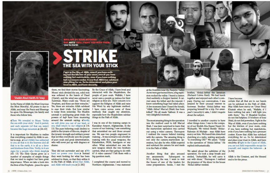
Figura 2. Página 14 del número 13 de la revista Inspire . En la parte central derecha aparece una imagen de Nemmouche.

personas 27 . El autor fue un ciudadano francés de origen argelino, Mehdi Nemmouche, integrado en las filas de Dáesh 28 antes de retornar a Europa.