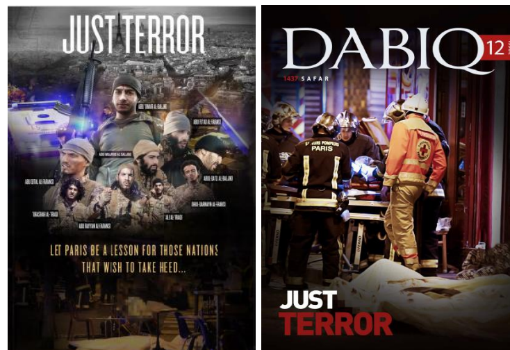
Figura 4. Imágenes de las revistas Dabiq 12 y 13 sobre los atentados de París de noviembre de 2015. Datos disponibles en el siguiente enlace: https://jihadology.net/

material de los hechos: el belga de origen marroquí Abdelhamid Abaaoud, Abu Umar al Baljiki, quien, al igual que otros integrantes de la célula autora de los ataques, había formado parte de las filas del Dáesh en Siria y retornado posteriormente. Abdelhamid Abaaoud fue vinculado con los autores del atentado del Museo Judío de Bruselas y del tren Thalys 34 , así como con los retornados de Siria detenidos en la localidad belga de Verviers el 15 de enero de ese mismo 2015 35 .