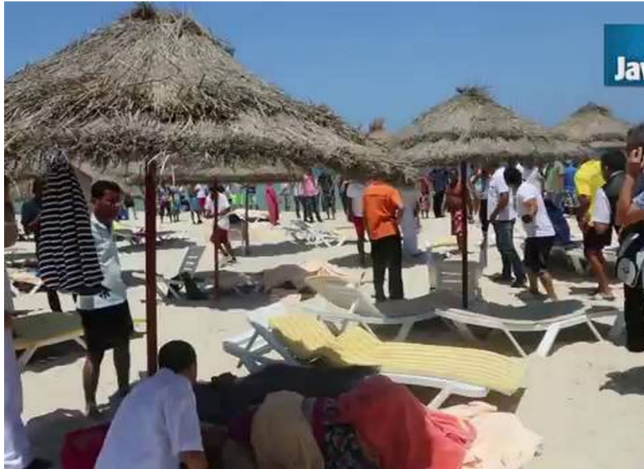
Imagen 1. Imágenes del atentado de Susa obtenidas de El País : https://elpais.com/internacional/2015/06/26/actualidad/1435319767_291028.html

A raíz de esta situación, el presidente tunecino llegó a afirmar que, de repetirse un atentado como el de Susa «... el país entero colapsará... » 7 , lo que da una muestra de la importancia de los ingresos del sector turístico para la economía del país.