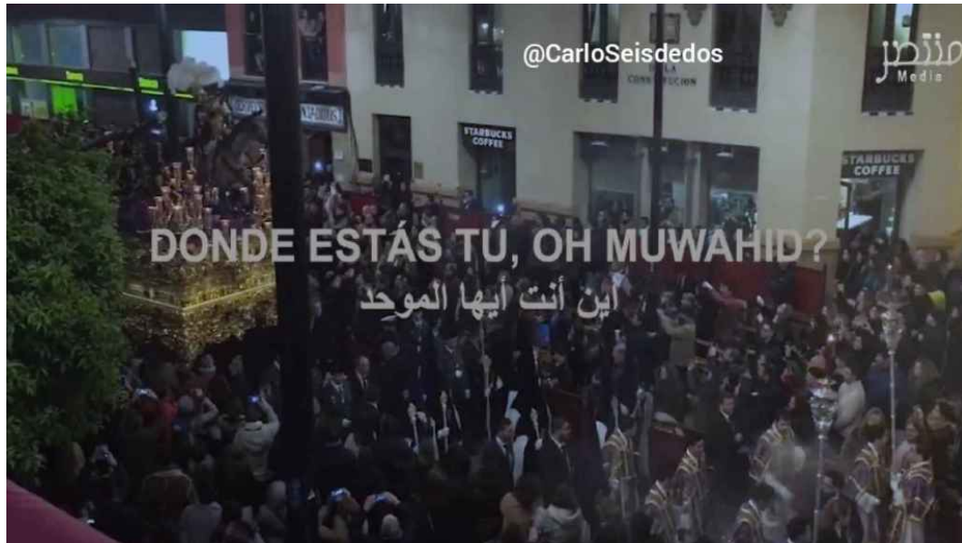
Imagen 3. Imágenes del vídeo de amenaza a la Semana Santa en España obtenidas del enlace: https://www.elspanol.com/espana/20190418/canales-islamico-llamado-atentar-espana-semana-santa/391711843_0.html

Respecto a lo mencionado en el párrafo anterior, cabe señalarse la detención de un súbdito marroquí que tenía la intención de atentar contra la Semana Santa de Sevilla en el año 2019 27 .