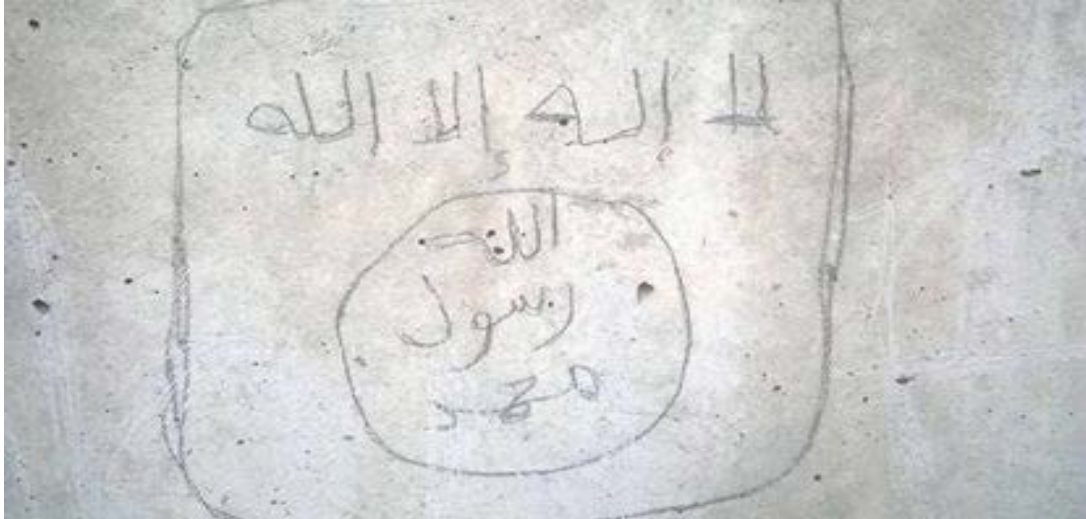
Imagen 4. Imagen de las pintadas efectuadas en la prisión española de Estremera recuperada del enlace: https://elpais.com/politica/2017/05/11/actualidad/1494529047_872232.html

La estancia de estos en prisión podría conllevar el desarrollo de labores de captación y adoctrinamiento terrorista o incluso llegar a cometer acciones violentas 34 , así como el riesgo de que, después de su salida de prisión tras cumplir condena, pudieran reincidir en su implicación en actividades terroristas 35 .