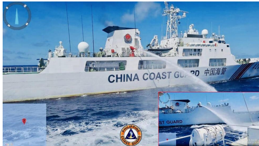
Figura 3. Un buque de la Guardia Costera china disparando un cañón de agua a presión contra una misión de reabastecimiento filipina a principios de agosto de 2023

ellas. Junto a la publicación del video, las autoridades filipinas expresaron su rechazo hacia los hechos: «La Guardia Costera filipina condena firmemente las peligrosas maniobras de la Guardia Costera china y su uso ilegal de cañones de agua contra nuestras embarcaciones» 14 . Si bien Filipinas está acostumbrada a las maniobras de los guardacostas chinos, el empleo de un cañón de agua a presión suponía un nuevo hito.