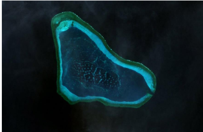
Figura 2. Atolón de Scarborough

Semanas después de estas declaraciones, Estados Unidos y Filipinas llegaron a un acuerdo para garantizar el acceso americano a cuatro bases militares en territorio filipino, bases con el potencial de aumentar las capacidades de vigilancia y de respuesta ante futuras incursiones chinas en la región. Aunque no haya un despliegue permanente, las bases servirán como un importante núcleo para realizar entrenamientos conjuntos a fin de mejorar la interoperabilidad. Poco después de este anuncio, China respondió subrayando que «esto puede escalar las tensiones y poner en peligro la paz y la estabilidad de la región» 12 .