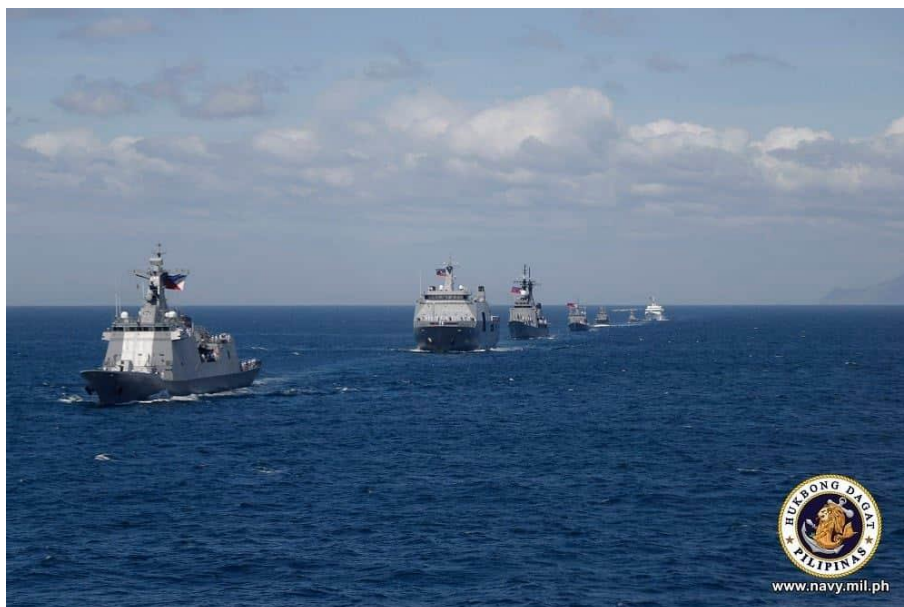
Figura 5. Desfile de la flota filipina por el 85.º aniversario de sus Fuerzas Armadas

antisubmarinas, antisuperficie y antiaéreas. Asimismo, se han comenzado a construir dos corbetas para apoyar a las fragatas mencionadas 28 y se busca aumentar la flota de unidades más pequeñas con 10 patrulleros y 24 lanchas de asalto anfibio. Estados Unidos anunció la entrega de dos patrulleros clase Cyclone en marzo de 2023, anteriormente empleados por la Guardia Costera estadounidense y equipados con ametralladoras de calibre 50 y lanzadores de granadas automáticos 29 . En abril se incorporaron a la flota de Filipinas dos patrulleros clase Acero construidos en Israel, y se espera que más patrulleros de altura («offshore patrol vessels» en inglés) les sigan en los próximos meses 30 .