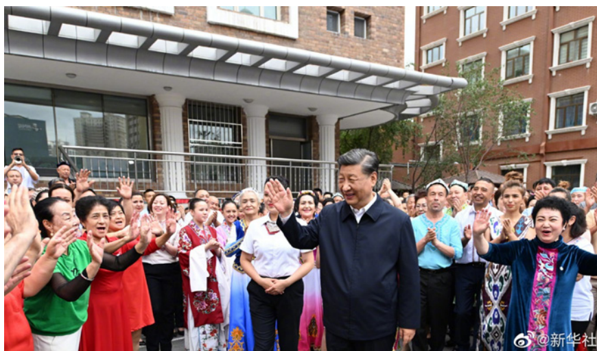
Figura 7. Fotografía tomada durante una visita de Xi Jinping a Urumqi en julio de 2022.

En septiembre de 2023 se informó de una nueva campaña del Gobierno chino llamada eufemísticamente «un pueblo, una puerta». Según fuentes policiales chinas, esto significaba la construcción de muros perimetrales en aldeas y ciudades habitadas por uigures, lo que se bautizó como la «construcción de nuevas aldeas» o proyectos para «embellecer los barrios», pero que en realidad esconden una fuerte restricción de la libertad de circulación de los uigures en su propio territorio (Hoshur, 2023).