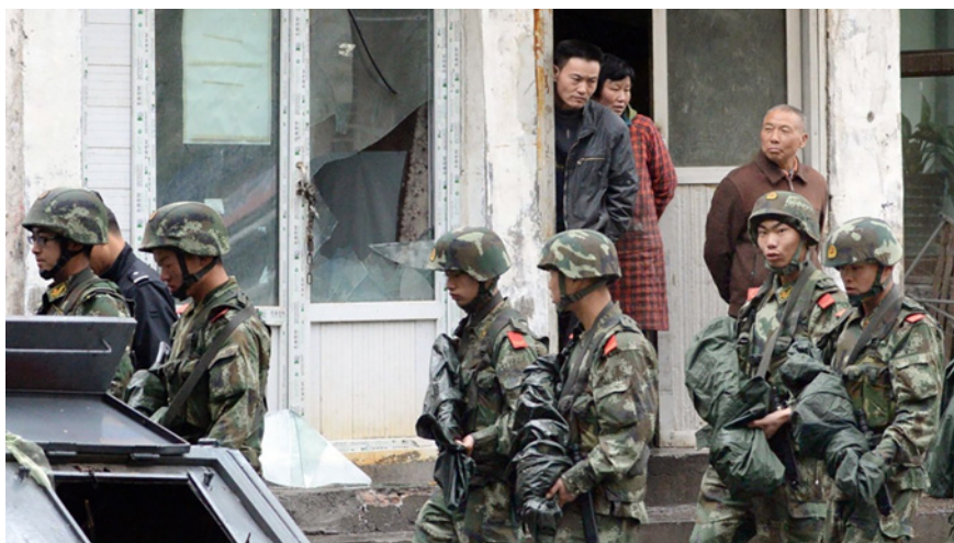
Figura 3: Policías armados patrullan junto a un edificio dañado por una explosión en Urumqi el 22 de mayo de 2014.

a la causa yihadista con fondos, armas y entrenamiento de terroristas de origen uigur provenientes de Xinjiang. Se calcula que entre 1990 y 2016 hubo cientos de ataques terroristas de diversa intensidad que tuvieron como objetivos principales a las fuerzas de seguridad chinas en la región (Janes Terrorism and Insurgency Center, 2020).