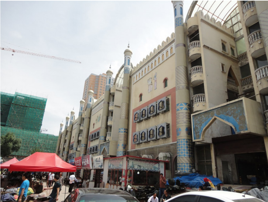
Figura 2: Una mezquita en Urumqi rodeada de grandes edificios: tradición frente a modernidad

El MITO era una organización armada creada en 1989 con el fin de conseguir la independencia del pueblo uigur, pero las anterio-