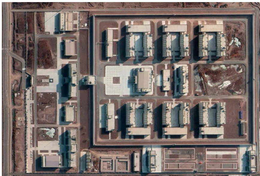
Figura 6. Imagen de un centro de internamiento cerca de Kashgar, geolocalizado en enero de 2020.

sofisticación y aceleración de estos sistemas de control y los volvió cotidianos. El número de comisarías de «policía comunitaria» ha aumentado y cuenta con decenas de miles de agentes equipados con equipos de vigilancia de alta tecnología, tales como software de reconocimiento facial y de voz, que incluso permiten crear perfiles de posibles alborotadores antes de que se produzca manifestación alguna (Roberts, 2018).