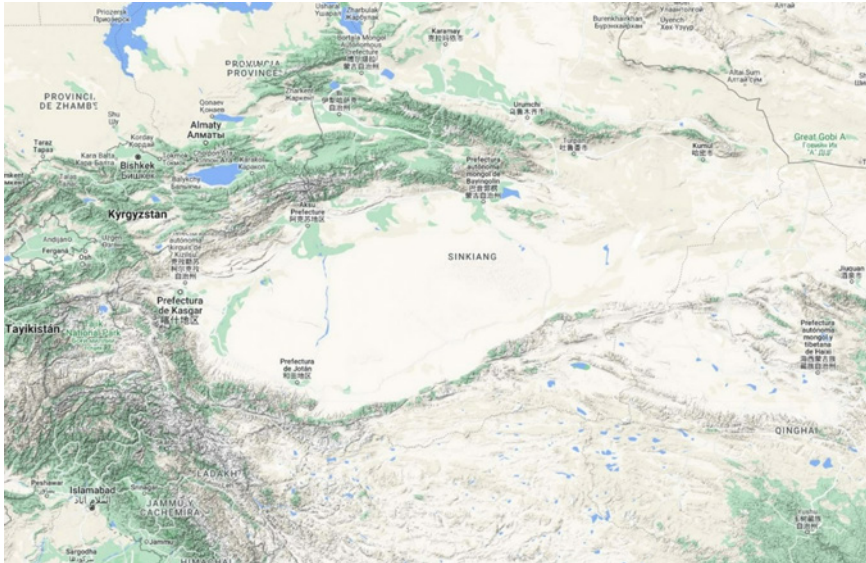
Figura 1: Mapa físico de la región de Xinjiang