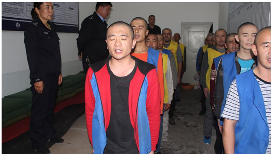
Figura 5. Imagen de la Fundación Memorial de las Víctimas del Comunismo que muestra a detenidos, supuestamente de confesión musulmana, custodiados por la policía en un centro de detención de Xinjiang.

internacionales, incluidos funcionarios de la propia Unión Europea, sin restricciones a los campos de internamiento, a la par que se instaba a enviar una misión bajo el marco de Naciones Unidas. Estas iniciativas no fueron respondidas desde China (Parlamento Europeo, 2020).